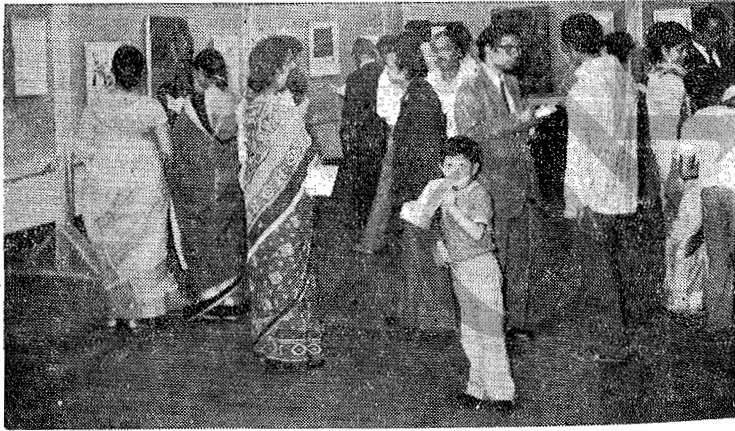
ছিল্ডৰ উত্তৰ-পূব পাৰ্বত্য বিশ্ববিদ্যালয়ত পতা গুৱাহাটী আৰ্টিষ্ট গীল্ডৰ চিত্ৰপ্ৰদৰ্শনী।

অৰ্থাৎ বৰ্তমান আমাৰ যি ব্যৱহাৰিক কলা-চৰ্চা চলি আছে তাক এটা বিশিষ্ট মানদণ্ড দিবলৈ যত্ন কৰিছোঁ, যাতে তাৰপৰা আমাৰ আবশ্যকীয় খৰছ পাতি যোগাব